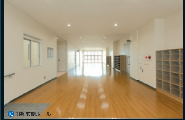
10 1階 玄関ホール