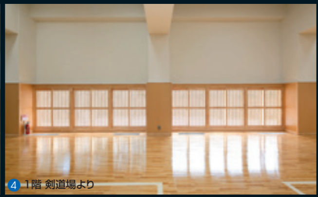
4 1階 剣道場より