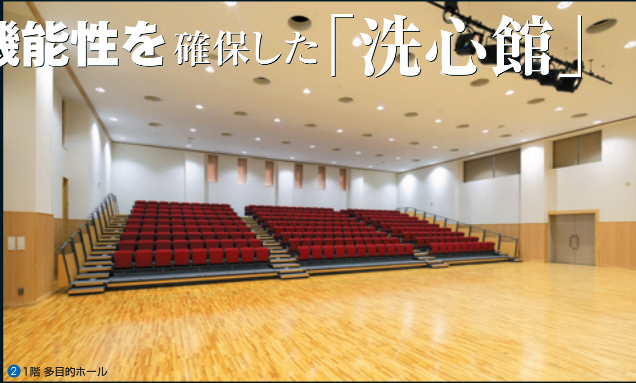
2 1階 多目的ホール