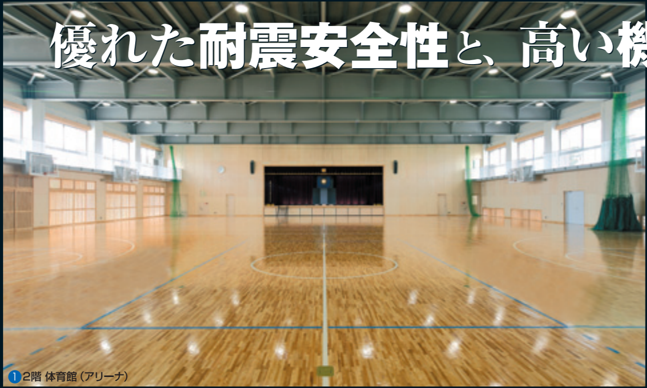
1 2階 体育館(アリーナ)