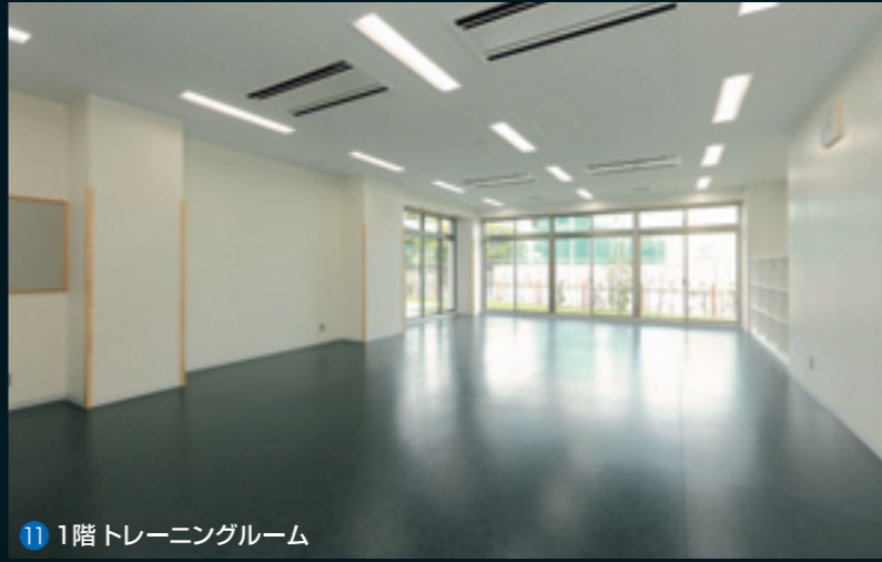
11 1階 トレーニングルーム