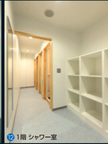
12 1階 シャワー室