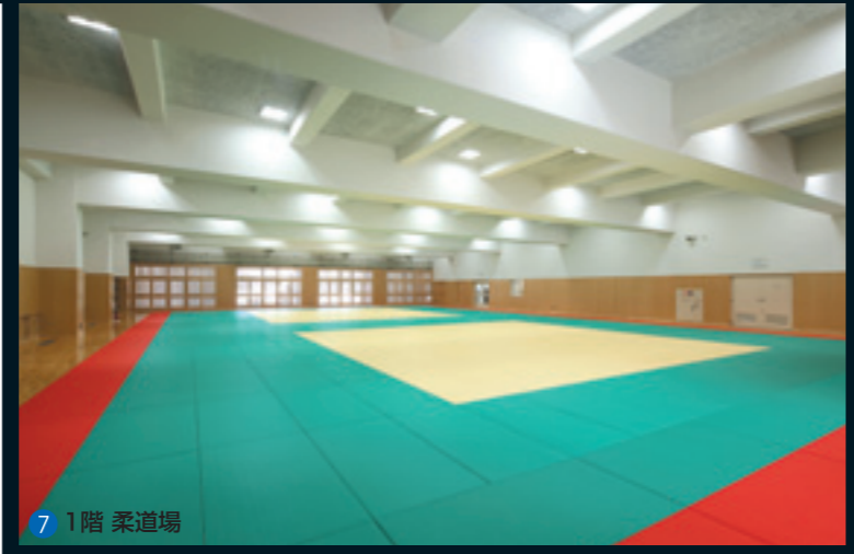
7 1階 柔道場