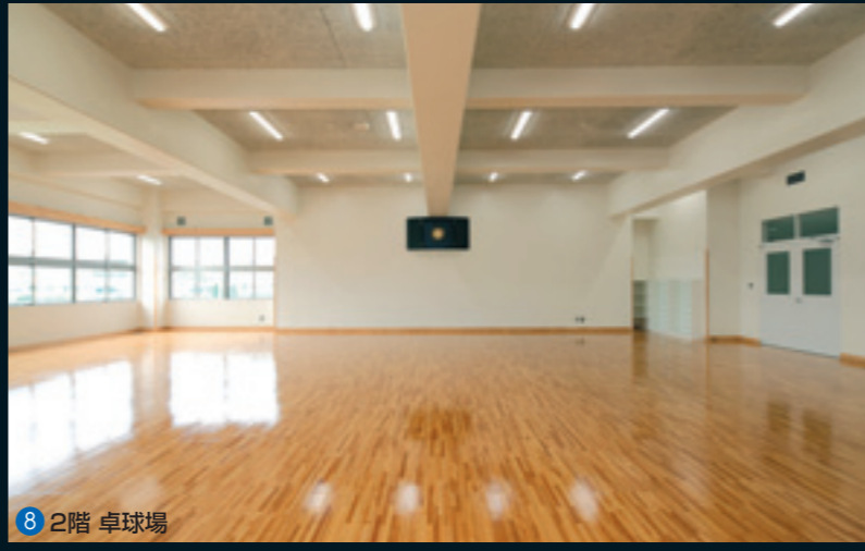
8 2階 卓球場