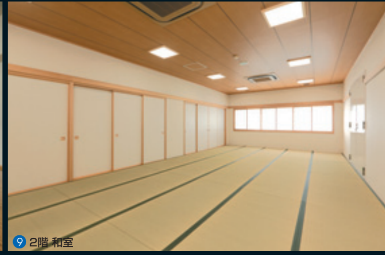
9 2階 和室