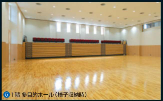
5 1階 多目的ホール(椅子収納時)