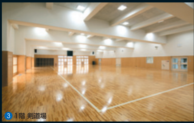
3 1階 剣道場