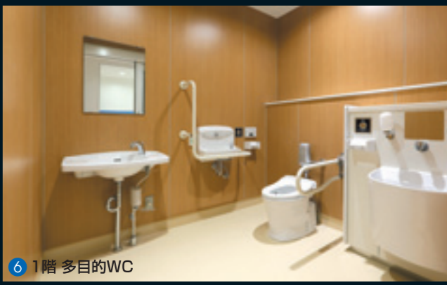
6 1階 多目的WC