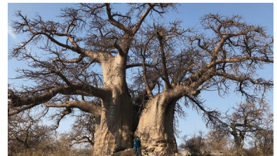
ボツワナのバオバブの木