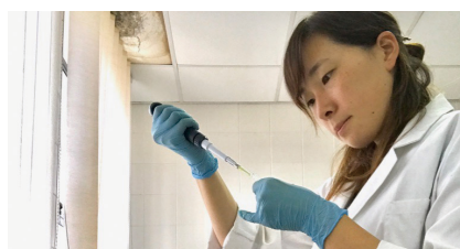
実験中はいつも緊張します