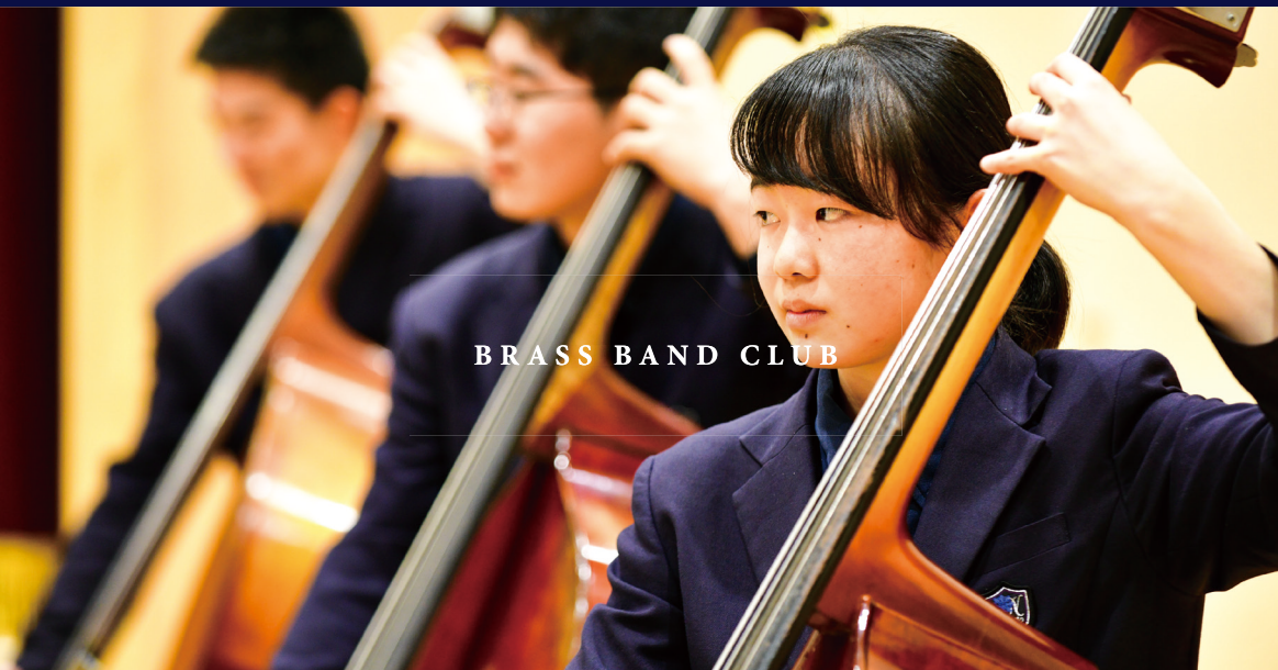
BRASS BAND CLUB