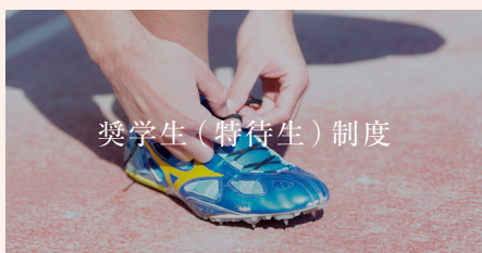
奨学生(特待生)制度

※2年次からのコース内の選択に加え科目選択もきめ細やかになっています。 ※表中の○印は選択科目を表します。