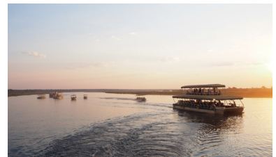
夕陽の差すチョベ川。4カ国の国境地帯