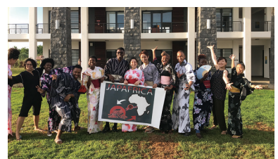
日本文化発信イベントを開催しました！