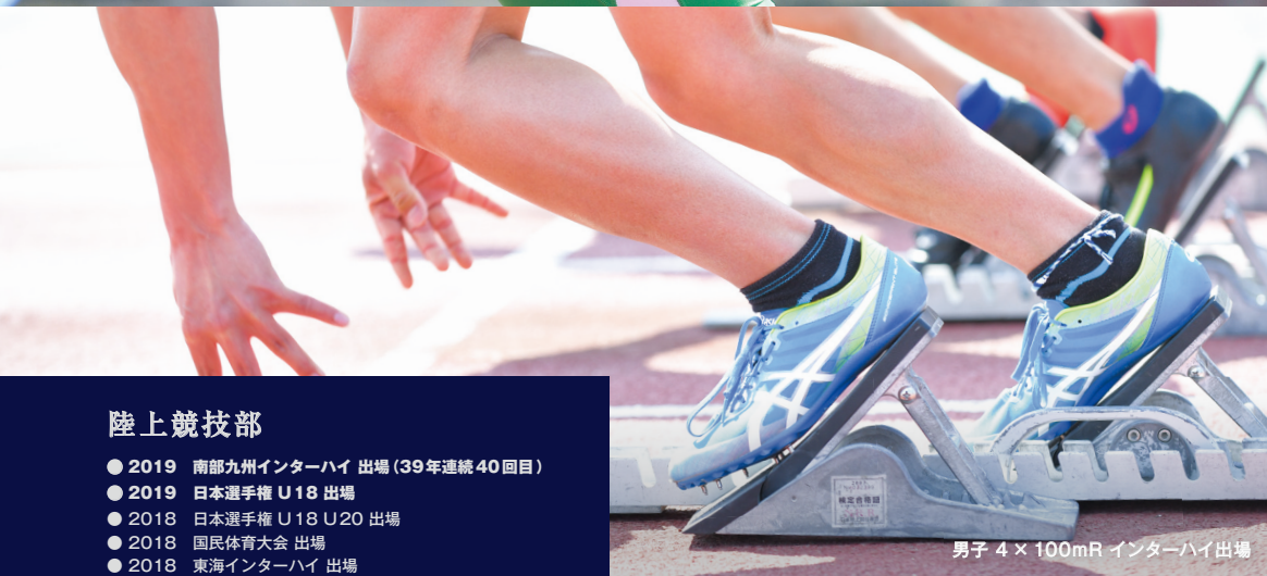
男子 4 × 100mR インターハイ出場