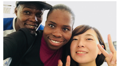
研究室の同級生との1枚